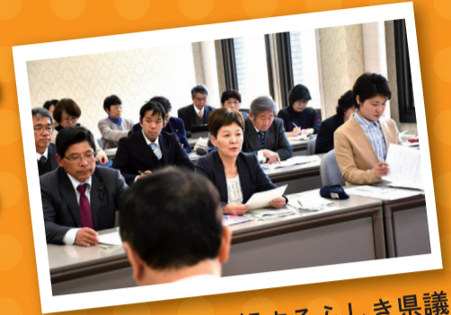
2月6日県に要望するふしき県議