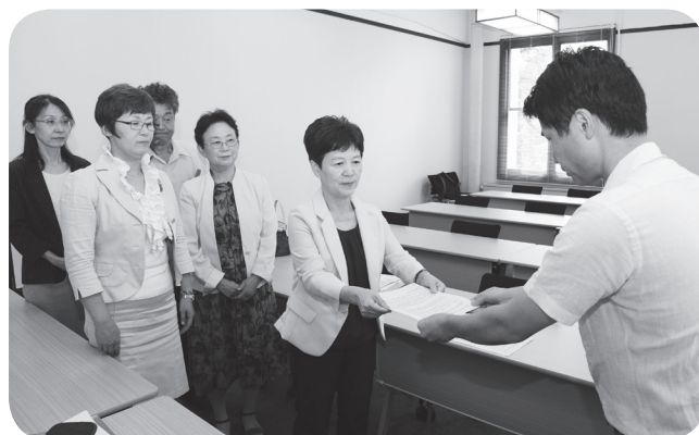
( ふしき )

要請では、①対象を拡大するよう政府に求めること ②電気代を心配せずエアコンが使用できるよう夏季加算をつくるよう国に求めること ③県独自の補助などを求めています。県の担当者は、「夏季加算については国へ要望していく」と述べました。8月21日の政府交渉でも、厚生労働省に対して、対象者の拡大などを求めました。