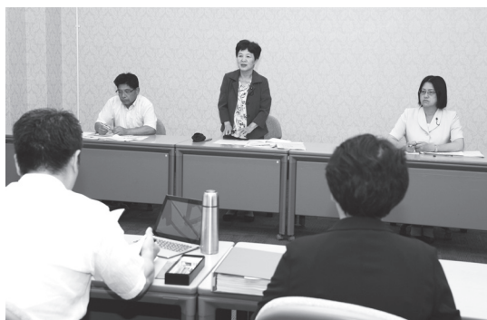
三日月知事と共産党県議団との「政策懇談会」

県民世論に押された三日月知事は8月28日、日本共産党県議団との「政策懇談会」で、未整備の高校の普通教室・特別教室にエアコンを来年夏までに設置する方針を示しました。9月議会に補正予算として提案される予定です。