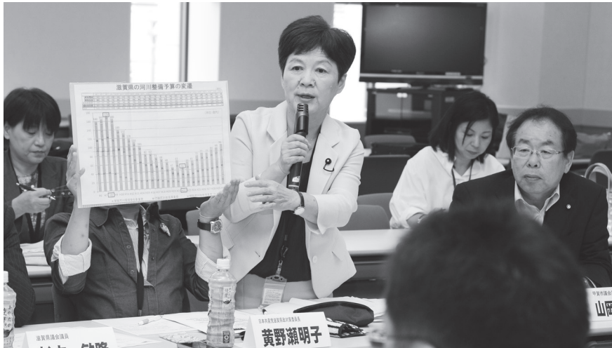
河川整備・改修の滋賀県予算を示して国土交通省に迫るふしき県議

西日本豪雨災害は、「平成最大の被害」となりました。近年のゲリラ豪雨など短期間の記録的な降雨によって、河川が氾濫し、水害や土砂災害をもたらしています。