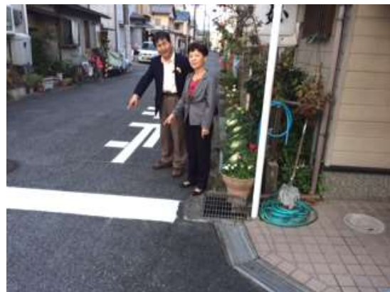
立道市議と現地を確認

また、葛川にお住まいの方から「(豪雪の時)表にも出られない。死活問題。今のうちに対応を考えてほしい」と歩道の除雪の要望が寄せられました。現地の写真を見せて、大津土木事務所に対応を求めました。(ふしき)